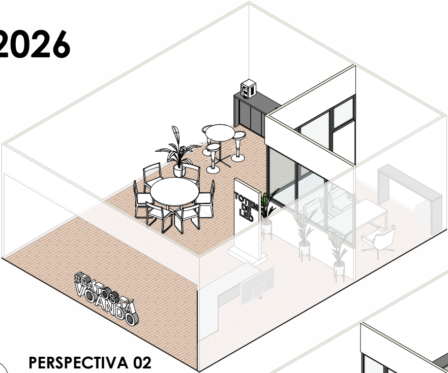
3 PERSPECTIVA 02