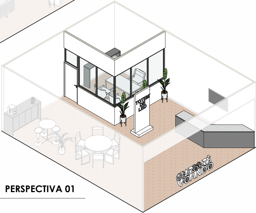
2 PERSPECTIVA 01